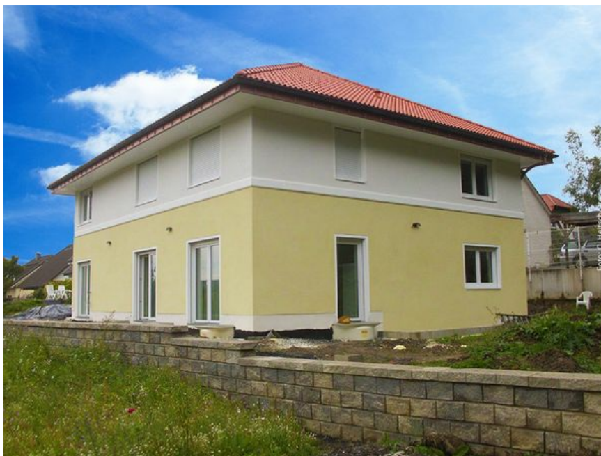
Eine schicke Stadtvilla im Sauerland mit charakteristischer Stuckleiste und zwei verschiedenen Putzfarben.

Arnsberg. Warum immer nur Weiß? In der Gestaltung von Wohnräumen ist Farbe längst angekommen. Von weichen Pastelltönen bis zum knalligen Rot ist erlaubt, was gefällt! Was Innen mittlerweile selbstverständlich ist, ist im Außenbereich hier im Sauerland eher die Ausnahme.